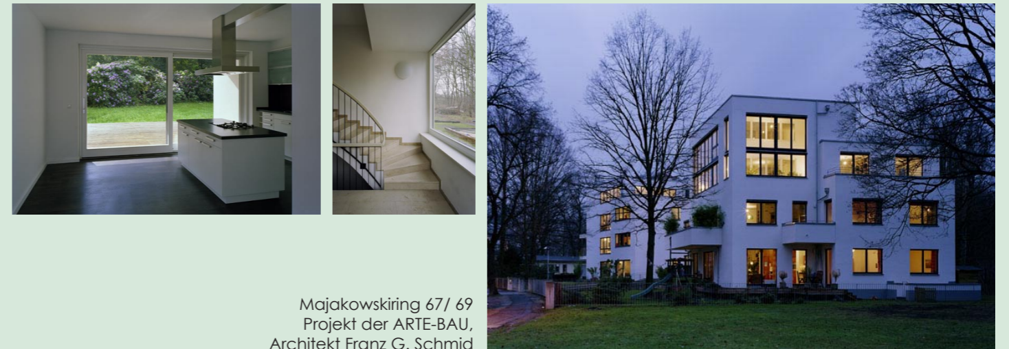
Majakowskiring 67/ 69 Projekt der ARTE-BAU, Architekt Franz G. Schmid