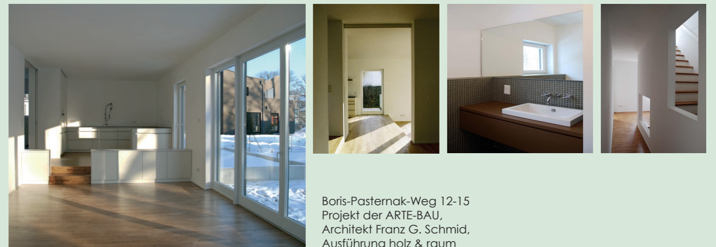
Boris-Pasternak-Weg 12-15 Projekt der ARTE-BAU, Architekt Franz G. Schmid, Ausführung holz & raum