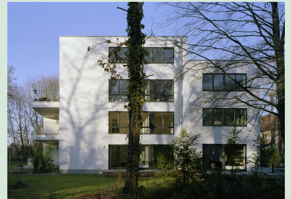
Referenzobjekt Majakowskiring 67/ 69

Die Wohnungen werden dem Wunsch nach Ruhe, Privatsphäre und Komfort gerecht. Durch eine elegante Architektur mit Blickachsen und dezenter Farbgebung harmonieren die Gebäude mit den historischen Bauten der Umgebung.