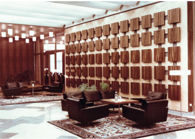
Die repräsentative Innenausstattung vor der Privatisierung. Rechts: die Treppenhausverglasung, gestaltet von Walter Womacka.

Lageplan: Franz Schmid; historische Fotos: Archiv Schulze, Berlin