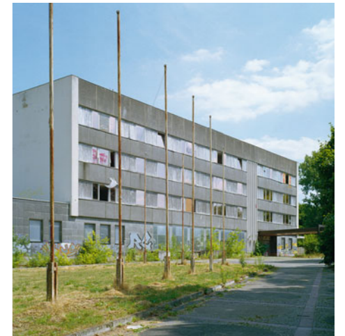
Das Appartementhaus stellt sich heute als sturmreifes Relikt aus vergangenen Tagen dar. Links: das Keramikwandbild „Erde, Wasser, Feuer, Luft“ von Walter Womacka.

Nach 1960 verlagerte sich der Wohn- und Regierungssitz der DDR nach Wandlitz und in das 1962–64 erbaute Staatsratsgebäude in Berlin-Mitte. Schloss Schönhausen sollte nur noch eine repräsentative Rolle zukommen: Es wurde zum Gästehaus für Staatsgäste umgebaut, dort fanden Empfänge und politische Treffen statt. 1965 wurde das Architekturbüro 110 unter Leitung von Walter Schmidt mit der Planung eines Appartementhauses für Staatsgäste als zusätzliche Erweiterung beauftragt. Der Entwurf zeigt deutlich die inzwischen erfolgte Ab-